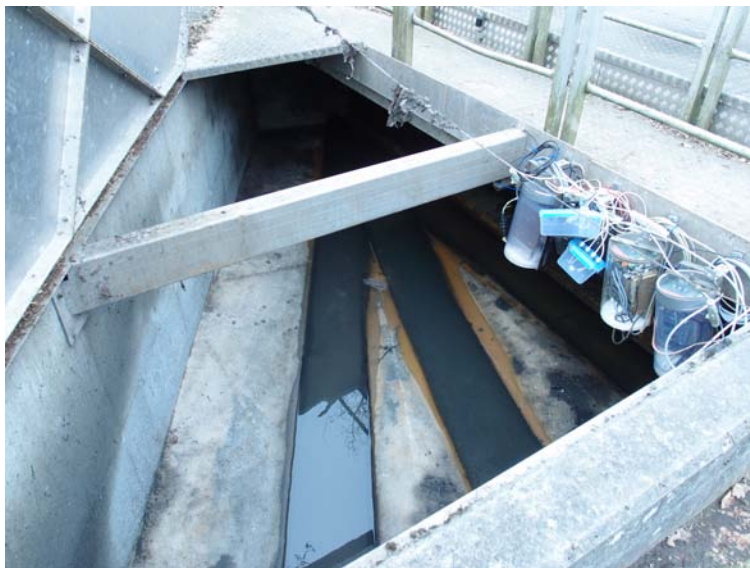
Bygværk med 3 flowmålere