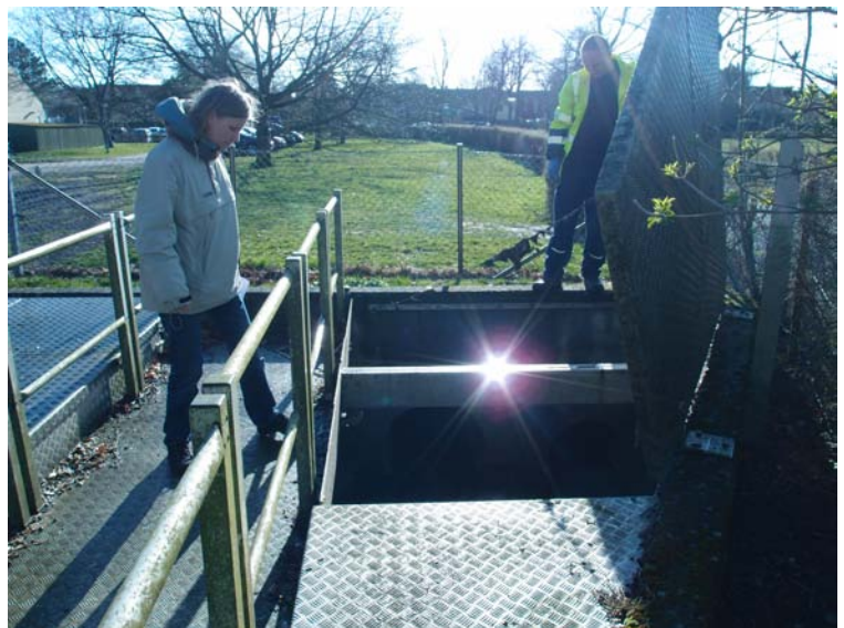
Alt udstyr er skjult under dækslet

Generet af programmet : makehtml.exe @HBJ TELETRONIC Denmark ApS 2009 email : info@teletronic.dk