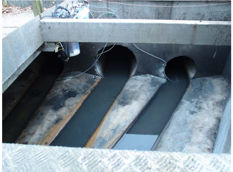
Flowmåler SF1 th. SF2 i midten og SF3 tv.