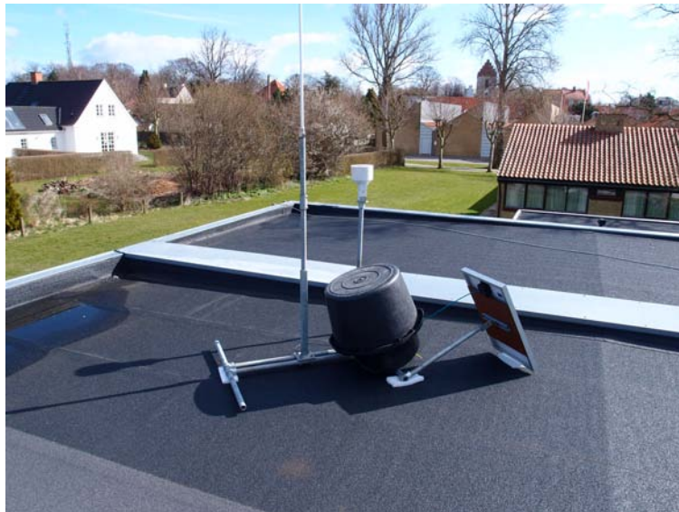
Regnmåleren er placeret på rådhusets tag og strømforsynes fra et elektrisk solpanel