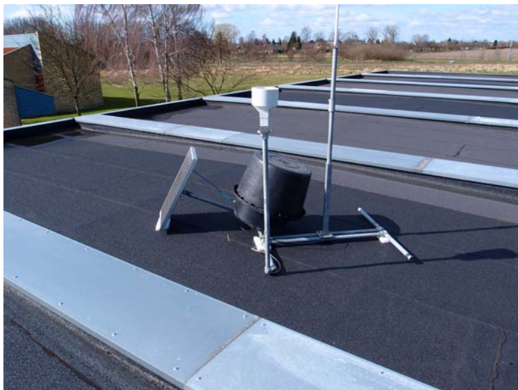
Under stativet er lagt blødt skumplastik for at beskytte tagbelægningen